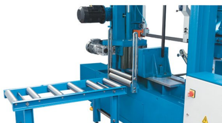
Mesa de rodillos de alimentación sólida y guía de material para paquetes de piezas de trabajo