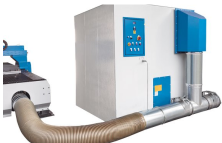
Sistema de aspiración y filtrado de polvo disponible como equipamiento opcional