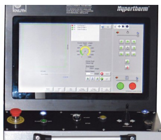
EDGE® Connect es la última plataforma CNC de Hypertherm que ofrece una fiabilidad superior, una potente funcionalidad integrada y es altamente personalizable