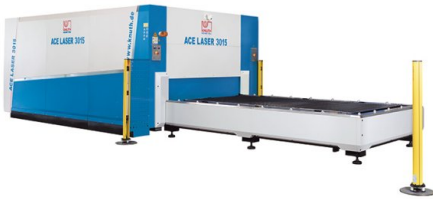
Sistem de masă de înlocuire automat cu sistem de protecție luminoasă