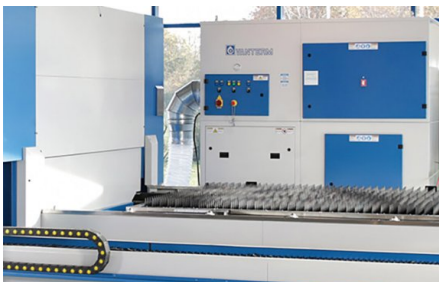
Die Maschine ist standardmäßig mit einem Staubabscheider und einer Filtrationseinheit ausgestattet und hat eine 99,997%ige Effizienz