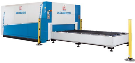
Sistem de masă de înlocuire automat cu sistem de protecție luminoasă