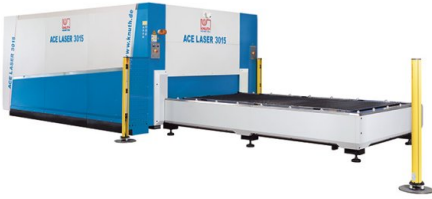
Автоматическая система сменных столов со световыми защитными барьерами