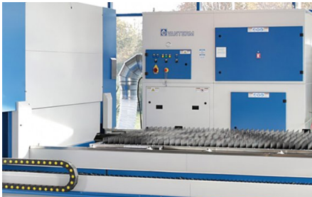
La máquina incluye un separador de polvo y una unidad de filtración con una eficacia del 99,997 %.