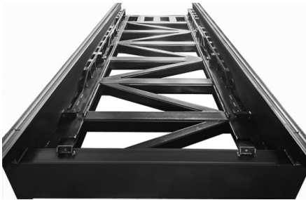
Le cadre est soigneusement soudé et fait l'objet d'un traitement thermique