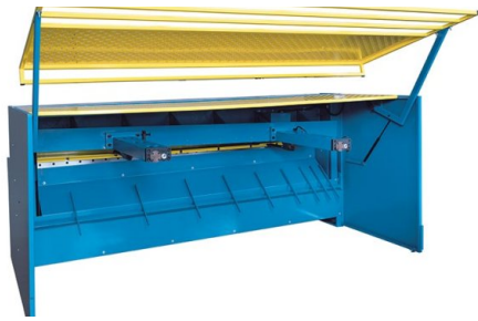
El área de trabajo accesible en el calibre trasero está asegurada con una puerta giratoria