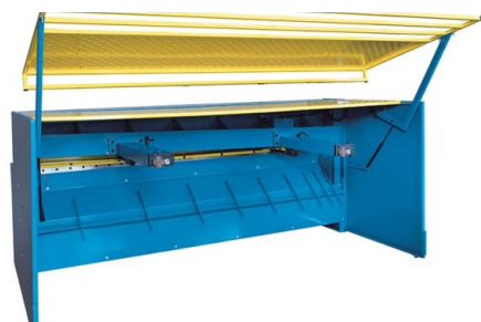
Spatiul de lucru accesibil de la opritorul spate este asigurat cu o ușă rabatabilă de mari dimensiuni