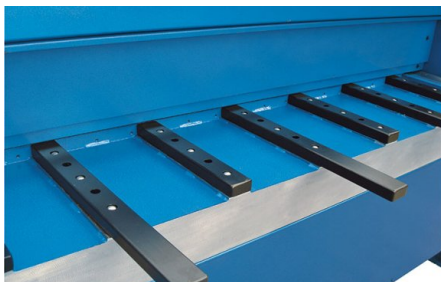
Brațele de suport robuste cu bile de susținere material simplifică manipularea și conferă rezistență până și tablelor de mari dimensiuni