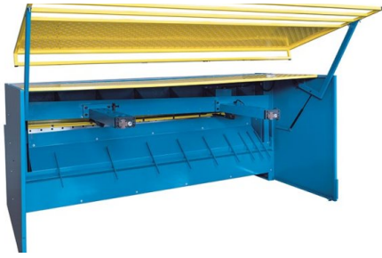
El área de trabajo accesible en el calibre trasero está asegurada con una puerta giratoria