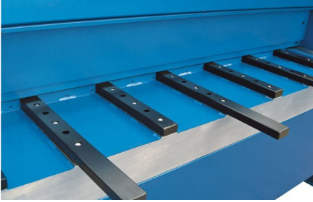
Los brazos de apoyo robustos con rodillos de apoyo de material simplifican la manipulación y proporcionan una sujeción segura para placas grandes