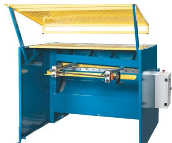
Поворотная защитная решетка рабочей зоны обеспечивает безопасность оператора