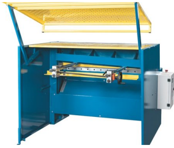
Acoperirea rabatabilă a spațiului de lucru pentru siguranța operatorului