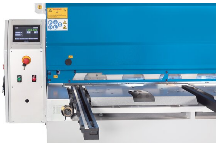
Боковой упор со шкалой и ручной регулировкой зазора резки