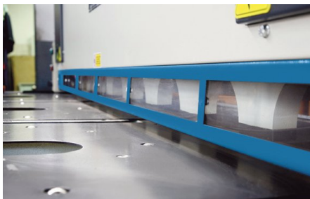
Los rodillos de soporte material se bajan en la mesa para una manipulación sencilla de las piezas de trabajo