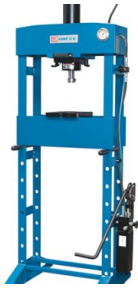
Fig. KNWP 30