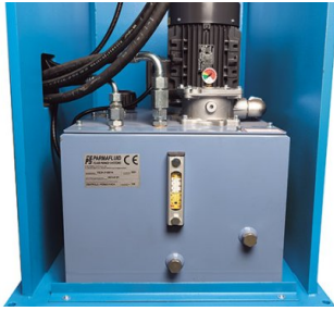
Le système hydraulique est peu encombrant mais intégré dans le châssis de manière facilement accessible