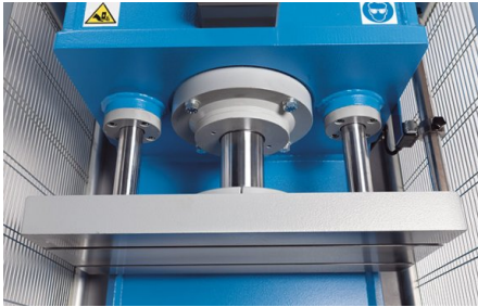
Deux guidages ronds supplémentaires garantissent le parallélisme de la plaque de coulisseau pendant le mouvement de levage