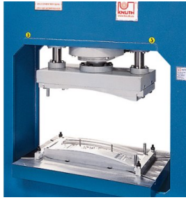
Fig. exemplu de lucru