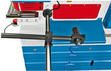
Задний упор с автоматической активацией резки

• HPS 45H и HPS 60 S оснащены мощным гидравлическим цилиндром • Модели HPS 65 H, HPS 85 H, HPS 115 H и HPS 175 H с 2 гидроцилиндрами для одновременной работы на 2 станциях