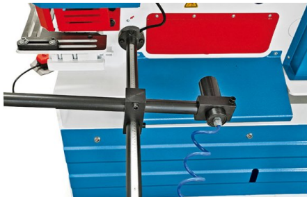
Butée arrière à déclenchement de coupe automatique

• les modèles HPS 45H et HPS 60 H sont équipés d'un puissant vérin hydraulique • les modèles HPS 65 H, HPS 85 H, HPS 115 H et HPS 175 H disposent de 2 vérins hydrauliques pour travail simultané sur 2 postesstacjach