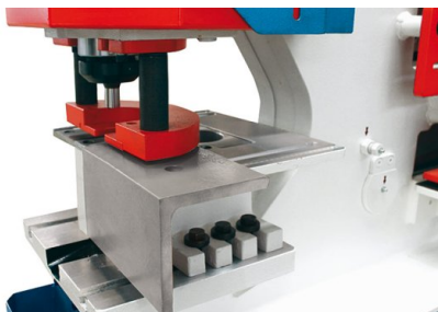
Stazione di punzonatura con ampia tavola di piazzamento