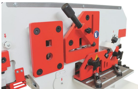
Kompaktní konstrukce a skvělá stabilita