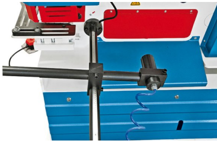
Opritor spate cu declanșare automată a tăierii

• HPS 45H și HPS 60 H dispun de un cilindru hidraulic puternic • Modele HPS 65 H, HPS 85 H, HPS 115 H și HPS 175 H cu 2 cilindri hidraulici pentru lucrul simultan la 2 stații