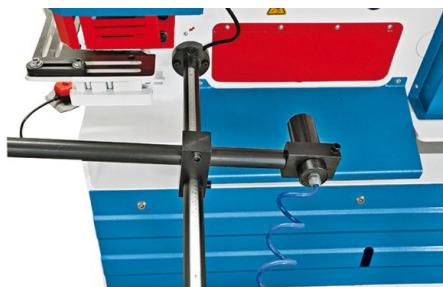
Zadní doraz s automatickým spuštěním řezu

• HPS 45H a HPS 60 H jsou vybavené silným hydraulickým válcem • Modely HPS 65 H, HPS 85 H, HPS 115 H a HPS 175 H se 2 hydraulickými válci pro práci současně na 2 stanicích