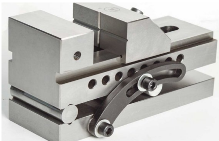
Úhlově nastavitelný svěrák pro broušení (standardní výbava)