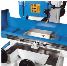
Permanentní magnetická upínací deska s jemnou pólovou roztečí - ideální pro precizní broušení