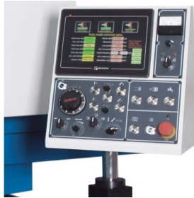
La programmazione dei cicli di rettifica avviene mediante Touchscreen