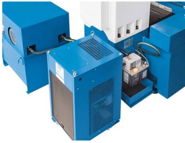
Zewnętrzny agregat hydrauliczny i chłodnica oleju zapewniają stabilność temperatury przy długiej eksploatacji