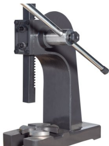
Ротационный оправочный пресс для протяжки, штамповки и прессования