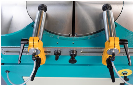
Verstellbare pneumatischen Werkstückspanner mit großen praktischen Spannhebeln