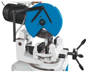
KKS 315 T