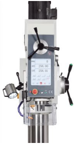
Bohrmaschine 2.0 - alle Funktionen auf einem robusten Touchscreen