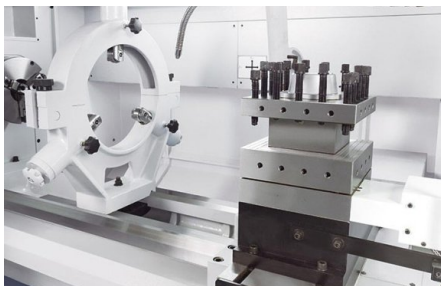
Automatický výměnný držák na 4 nože