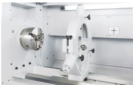
Опция: неподвижный люнет с диаметром до 400 мм