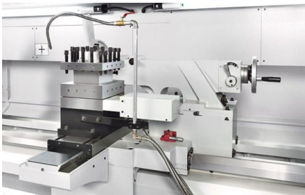
Leichte Handhabung: zum Positionieren kann der Reitstock an den Support gekoppelt werden