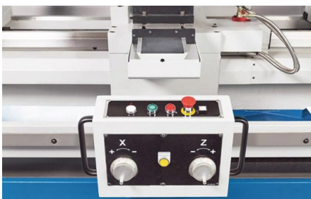
Kompakte Bedieneinheit mit elektronischen Handrädern