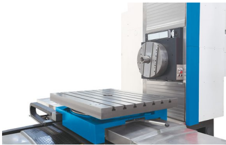
Tavola di serraggio con regolazione manuale dell'angolo, un mandrino CNC a griffe indipendenti è disponibile come optional